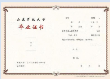
成人教育毕业证书样本

凡被我校录取的学生，在规定的学籍有效期内。修完教学计划规定的全部课程。学习期满，成绩合格。达到学校毕业要求的，颁发山东开放大学成人高等教育毕业证书，国家承认学历，教育部给予电子注册。达到学士学位授予要求的本科毕业生，发合作高校的学位证书，国家承认，教育部电子注册。毕业证书、学士学位证书、学信网可查。